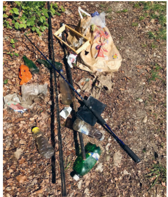
Sogar eine Fischerrute wurde illegal entsorgt.