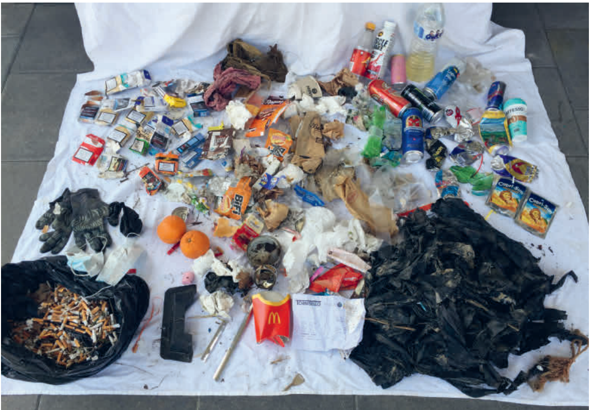
Von Bierbüchsen über Getränkebeutel bis hin zu Zigarettenstummeln ist alles dabei.

Fuss aufmacht zur Jagd nach Müll. «Pro Jahr sammle ich auf diese Weise rund 700 Kilogramm Abfall ein; während einer Tagestour kommt im Schnitt etwa ein Kilo pro Stunde zusammen», rechnet sie vor. Und sie legt Wert darauf, dass sie die Hinterlassenschaften bei den Gemeinden abgibt, auf deren Gebiet sie eingesammelt wurden. «Die Kooperation mit den lokalen Werkhöfen ist ausgezeichnet», bekennt sie. So erhalten die Kapeler ihren Müll, die Hägendörfer den ihren, und den Boninger Abfall übergibt sie Anlagewart Dieter Wyss. «Die Zusammenarbeit mit ihm ist absolut hervorragend», lobt sie.