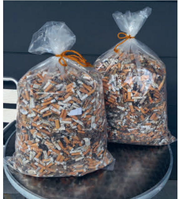
Die Hinterlassenschaften des «Homo fumaticus» sind zahlreich.